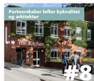
Pejlemærker fra Aarhus Kommunes Politik for Bykvalitet og Arkitektur (2022)